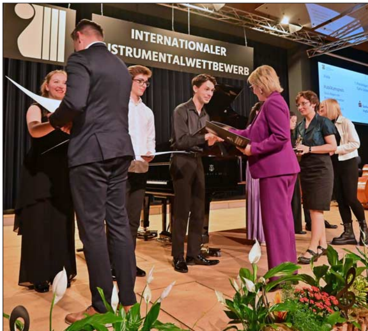
Die sächsische Staatsministerin für Kultur und Tourismus Barbara Klepsch bei der Preisübergabe des 60. Internationalen Instrumentalwettbewerbes.

Die Teilnehmerinnen und Teilnehmer, Mitglieder der Jurys, Ehrengäste, die Vogtland Philharmonie Greiz/Reichenbach und natürlich zahlreiche Zuhörer feierten mit einem bemerkenswerten Konzert den Abschluss des 60. Internationalen Instrumentalwettbewerbes.