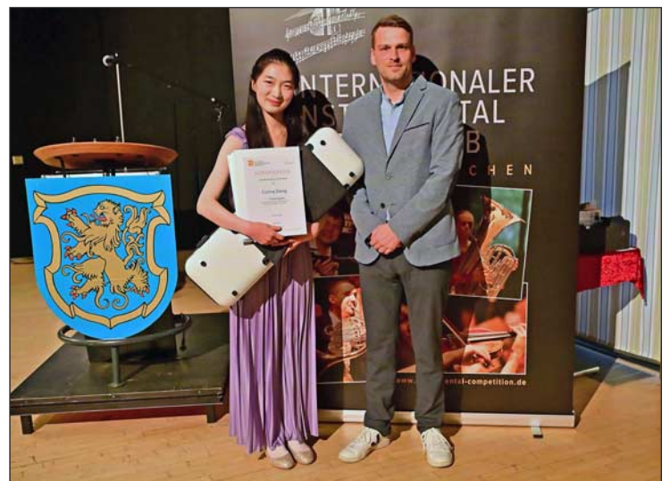
Die Erstplatzierten in beiden Fächern erhielten ein GEWA Air Violin- bzw. Violakoffer, gesponsert durch die GEWA Music GmbH