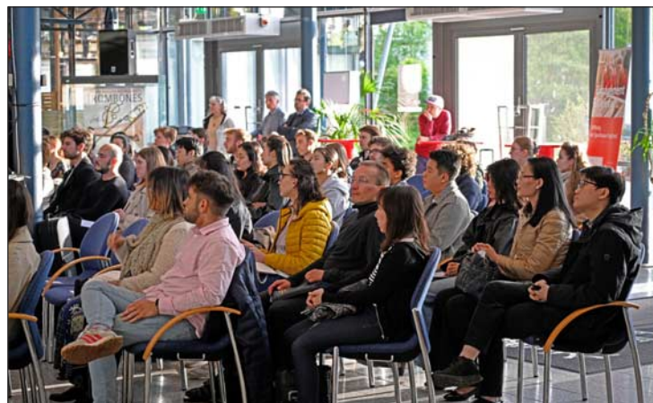
Gespannt warten die Wettbewerbsteilnehmerinnen und -teilnehmer sowie die Klavierbegleiter und -begleiterinnen im Foyer der Musikhalle auf die Auslosung der Wettbewerbsreihenfolge.