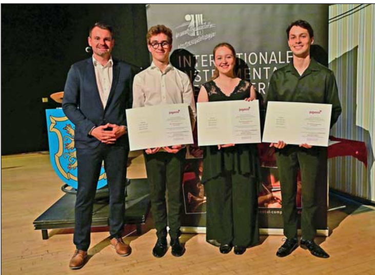
Die Preisträger im Fach Violine und Viola konnten sich über einen Gutschein in Höhe von 50,00 Euro der Paganino freuen, die von Toni Meinel überreicht wurden.