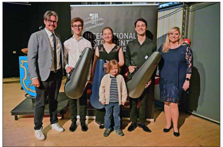
Die Preisträger im Fach Viola erhielten einen Violakoffer der Marke BAM, je einen Satz Thomastik-Saiten und je ein Accessory Bundle. Gestiftet wurde dies von der Firma von der Firma C.A. Götz jr.