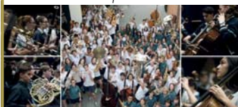
CHURCHLANDS SYMPHONIC Orchestra · 08.07.