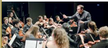
MORITZBURG ORCHESTER Orchesterkonzert · 21.08.