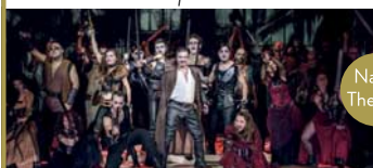
IL TROVATORE Verdi-Oper · 19.06.