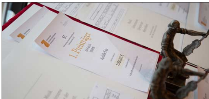
Urkunden und ein Markneukirchner "Oskar" für die Preisträger.

Tickets: VVK: 16 € / 13 €; AK: 18 € / 15 € Schüler:innen, Studierende 5,- €