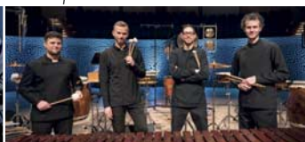
ELBTONAL PERCUSSION Klassik, Jazz & Pop · 10.06.